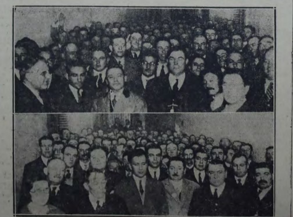
DOS VISTAS TOMADAS DURANTE EL LUNCH EN HONOR DE LOS DELEGADOS FERROVIARIOS ORGANIZADO POR LA UNIÓN OBRERA MUNICIPAL que se llevó a cabo el domingo en el local de la calle Moreno 3281