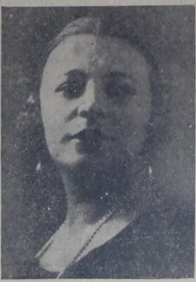
LA CELEBRADA CONTRALTO GABRIELA BESANZONI QUE ESTA NOCHE REAPARECERÁ EN EL COLON