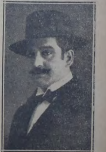
UN VERDADERO MAESTRO DE LA GUITARRA que prestó su concurso en el festival de anoche en la Casa del Pueblo.

la electroa, que el público escuchó con verdadero recogimiento. Acto seguido el concejal Américo Ghioldi pronunció una conferencia sumamente aplaudida en la cual señaló la meritoria labor del comité "Luoni" y la necesidad de cooperar con él.