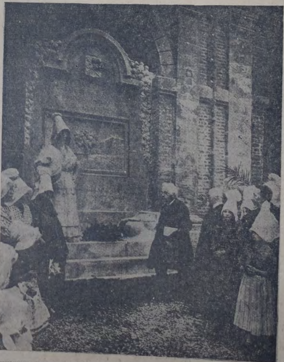
EN VINOUTIER, FRANCIA, HA SIDO INAUGURADO UN MONUMENTO A LA CAMPESINA MARIA HAREL, creadora del famoso queso de Camembert, que constituye la gran industria de toda una región. Nuestro grabado reproduce la ceremonia de la inauguración presidida por Millerand.