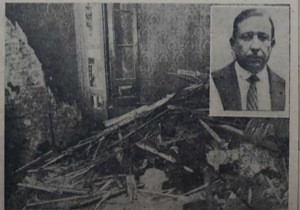
UN ASPECTO DE LOS DESTROZOS CAUSADOS POR LA BOMBA. — ARRIBA: EL FASCISTA ALFETRA, contra quien iba dirigido el atentado.