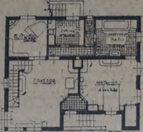
Croquis que muestra las comodidades proyectadas en la planta baja y piso alto

La cocina y baño separanse de las habitaciones por un corredor. Aquélla con una despensa vecina, ventilada al exterior; el baño en contacto con el dormitorio amplio y con abundante luz.