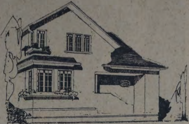
Perspectiva de la vivienda cuyo plano de distribución damos más abajo

En la arquitectura moderna, el proyecto de una vivienda se realiza siempre de acuerdo a un propósito preestablecido. Toda construcción a idearse tiene, como base, un programa que se- cipal, al mismo tiempo que sirve de corredor de salida de la habitación dormitorio de la planta baja. Sin gran rodeo penetramos en el comedor, bien iluminado, donde se halla